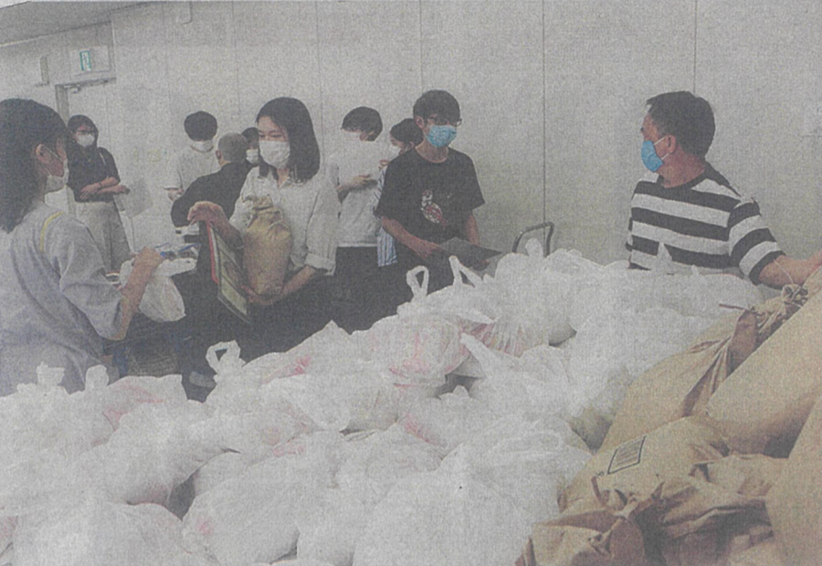
信州大のベトナム人留学生らが企画した集会で食料支援の物資を受け取る参加者たち＝長野市で

こうした外国人を支援するために、県多文化共生相談センターは、ベトナム語や中国語、ポルトガル語など十五の言語に対応可能な電話相談窓口を開設した。公的な経済支援策の説明だけでなく、相談してきた外国人がハローワークなどを訪れた場合に仲介役として電話で通訳したり、精神的な悩みに外国語で相談できる専用の電話窓口を紹介したりしている。