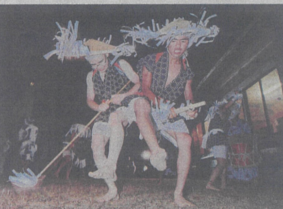
今年は一 generally 公開せず執り行われることになった和合の念仏踊り＝昨年8月13日、阿南町和合で

阿南町和合地区に江戸時代から伝わる「和合の念仏踊り」(国重要無形民俗文化財)は今夏、一考慮した。町はホームページ